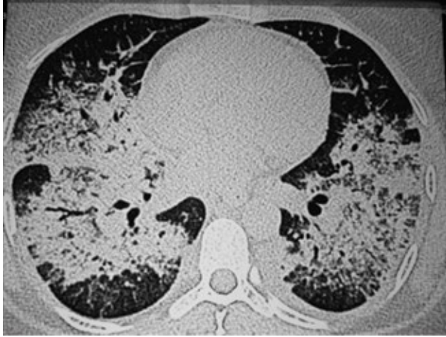
Figura 2. TC tórax simple: Ocupación alveolar parahiliar confluyente bilateral con zonas de extensión subpleural sin bronquiectasias de base y sin presencia de masas o engrosamientos septales.

de la Universidad Libre seccional Cali, por su especial interés y seguimiento para el diagnóstico y tratamiento de este caso.