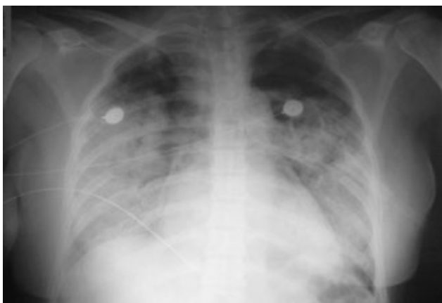
Figura 1. Radiografía de tórax AP (portátil): Opacidades de ocupación alveolar con tendencia a la consolidación multilobar bilateral con ligera predilección parahiliar, sin derrame pleural asociado y sin evidencia de nódulos o masas.

se ordenaron 3 pulsos de metilprednisolona 500 mg/día iniciales y posteriormente ciclofosfamida 1 g/m 2 . Su evolución no fue satisfactoria con empeoramiento clínico por hemoptisis masiva, anemia persistente y deterioro radiológico demostrado en la tomografía de tórax tomada a las 48 horas posteriores de su intubación orotraqueal (Figura 2).