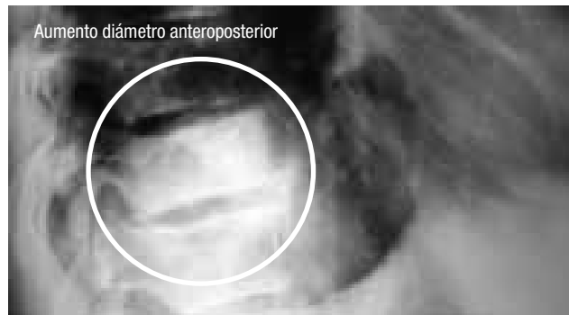
Figura 2. Paciente de sexo masculino de 58 años con compromiso vertebral con aumento del diámetro anteroposterior.