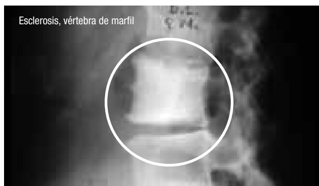
Figura 3. Paciente de sexo femenino de 74 años con vértebra de marfil.

es un aumento del tamaño anteroposterior y lateral de la vértebra.