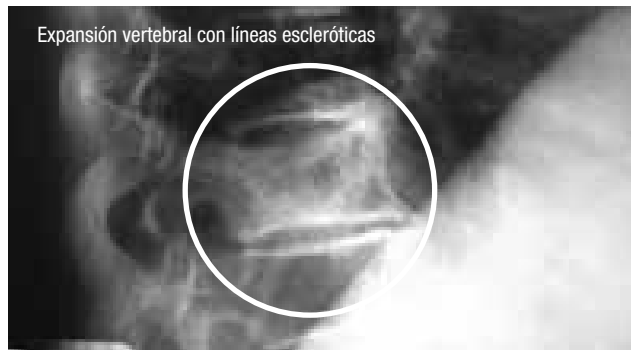
Figura 1. Paciente de sexo femenino de 80 años de edad con compromiso poliostótico, se observa expansión vertebral y líneas escleróticas.